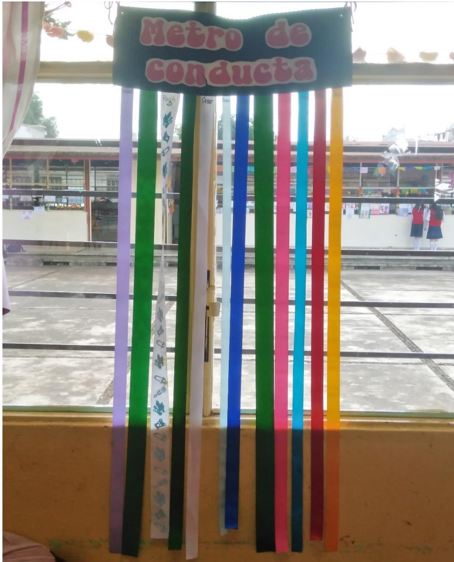
Figura 2. Metro de conducta. Cada niño llevó el listón de su preferencia y se puede mostrar como ya unos están más cortos a consecuencia de sus acciones negativas.